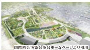
国際園芸博覧会協会ホームページより引用

交通渋滞の緩和、航空法による高さ制限の緩和、都市計画区域の見直しによる再開発促進、横浜市瀬谷区の国際園芸博覧会及びテーマパーク構想(仮称: KAMISEYA PARK)を見越した街づくり、玄関口である大和駅周辺へのコンベンション機能を備えたホテルの誘致などを目指します。