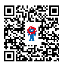
【出典】 https://www.mod.go.jp/j/press/expo2025/index.html https://www.expo2025.or.jp/news/news-20250207-01/